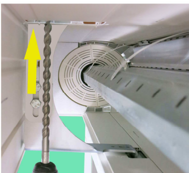
Löcher durch Konsole in Decke / Sturz bohren