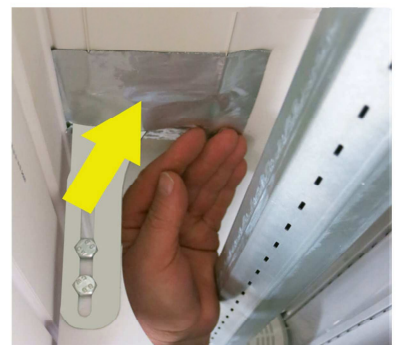
Durchgangslöcher in Deckelblende mit Butylpad verschließen