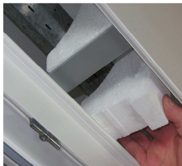
Dämmstücke in Statikkonsole einsetzen