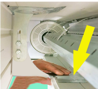
Statikkonsole auf Basisbrett mit beiliegendem Butylpad abdichten