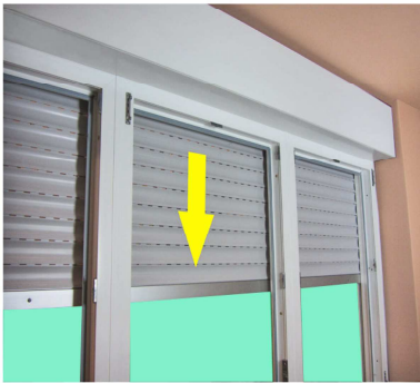
Rolladenpanzer an fertig montiertem Element schliessen