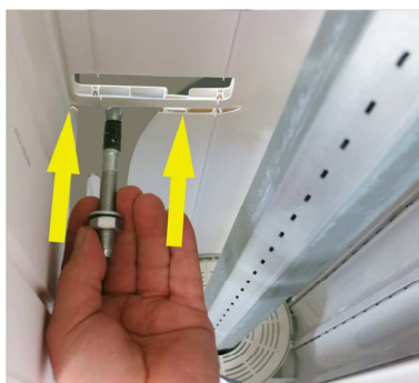
Statikkonsole mit geeigneten Schwerlastanker befestigen