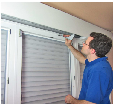
Statikkonsole durch Reviöffnung in Rolladenkasten einsetzen