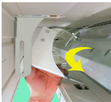
Konsole durch Basisbrett in Verstärkungseisen einhaken