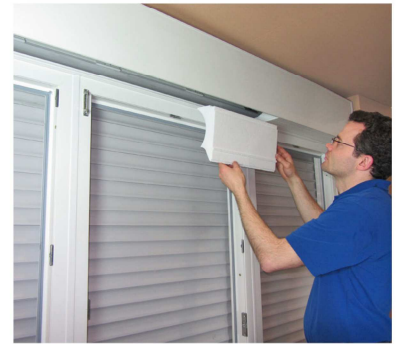
Dämmung und Dämmstücke aus Rolladenkasten entnehmen