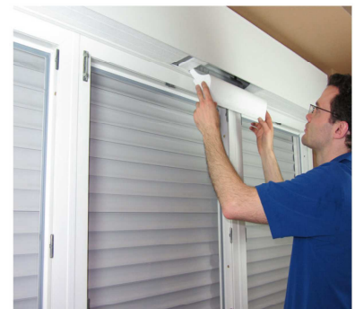
Dämmung einsetzen und Rolladenkasten schliessen